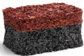
Red RAL: 3016