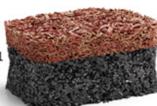
Brown Mix RAL: 3016 + 8024