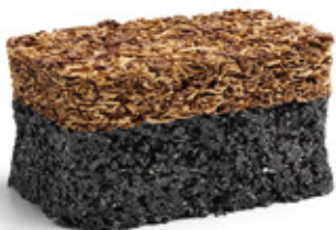
Beige Mix RAL: 8024 + 1001