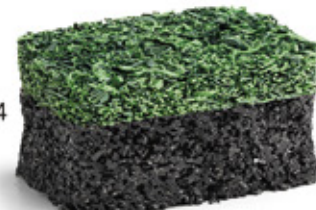
Green Mix RAL: 6017 + 6025