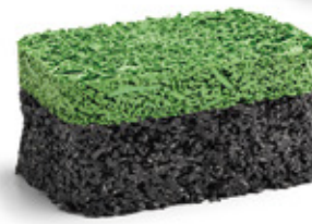
May Green RAL: 6017