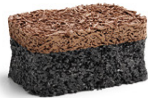
Brown RAL: 8024