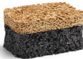
Beige RAL: 1001