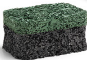
Rainbow Green RAL: 6025